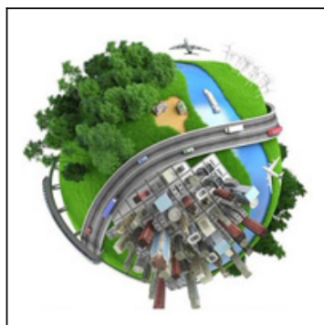
Edilizia e Urbanistica